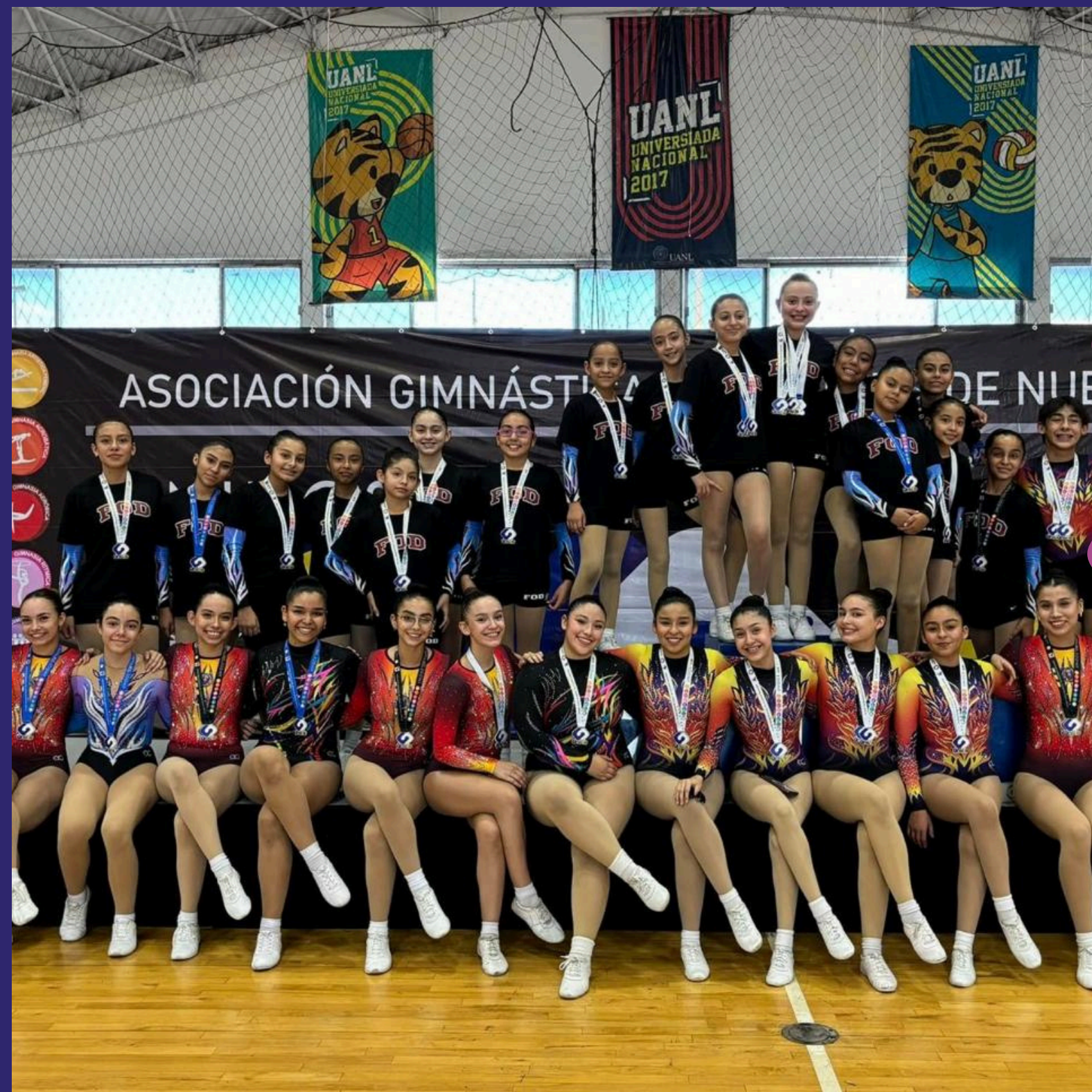
Campeonato Estatal Promocional 2024 Gimnasia Aeróbica

PONER A DISPOSICIÓN CLASES DEPORTIVAS DE GIMNASIA Y PARKOUR CON EL CONOCIMIENTO TÉCNICO Y EL DESARROLLO ADECUADO PARA NIÑOS Y JÓVENES. EN NUESTRAS CLASES LOS ALUMNOS DESARROLLARAN DESTREZAS, HABILIDADES FÍSICAS Y EL SENTIDO DEL RITMO, FAVORECIENDO A SU VEZ LAS CAPACIDADES DE FLEXIBILIDAD, FUERZA Y COORDINACIÓN.