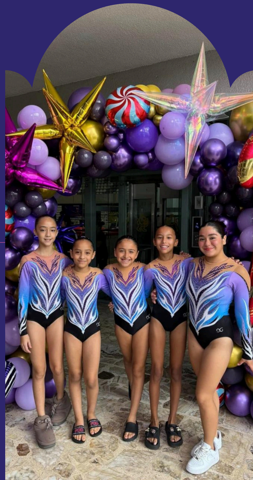
Copa Soleil y Fábrica de chocolates Octubre 2024