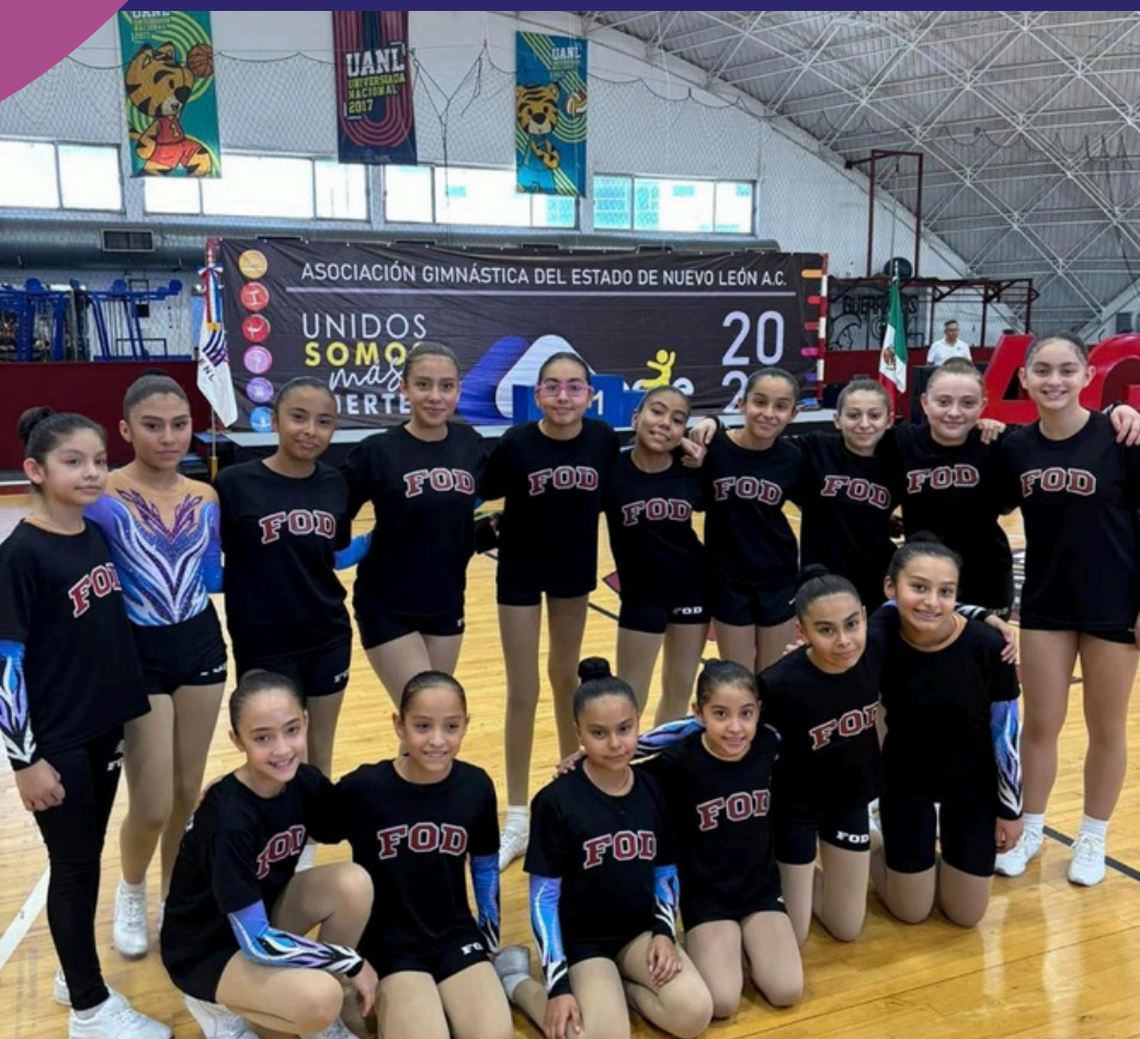
Campeonato Estatal Promocional 2024 Gimnasia Aeróbica