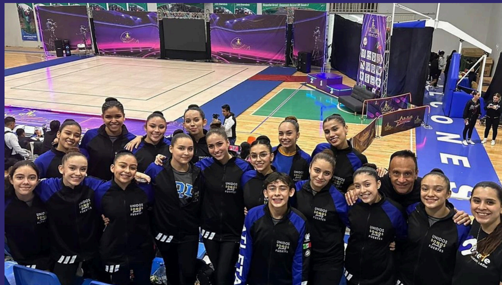
Campeonato Estatal de Gimnasia Artística 2024 gimnasio del Deportivo FUD, en San Pedro